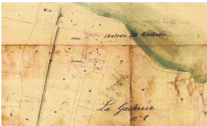
Extrait du Cadastre 1839 de La Chapelle-sur-Erdre - C3

Arthur l'Espervier, fils de ce dernier, hérite du manoir et des terres de la Gascherie en 1478. Il entreprend l'agrandissement du manoir en 1482 en prolongeant l'aile nord vers les fermes et en harmonisant l'ensemble des baies.